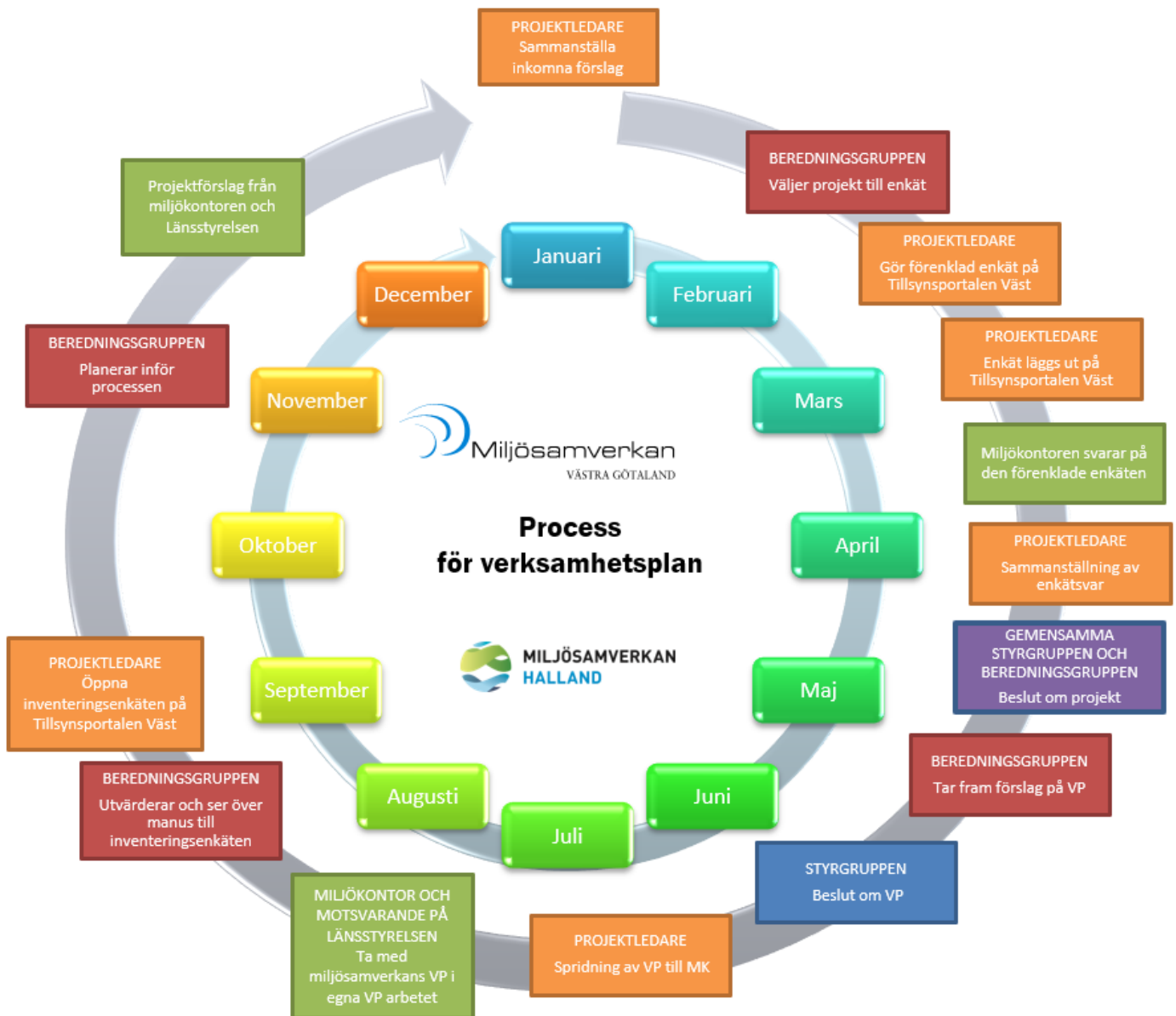
Figur 4. Schematisk bild över processen för verksamhetsplanering för miljösamverkan. Verksamhetsplanen och processen är gemensam med Miljösamverkan Halland. VP = verksamhetsplan, MK = miljökontor.