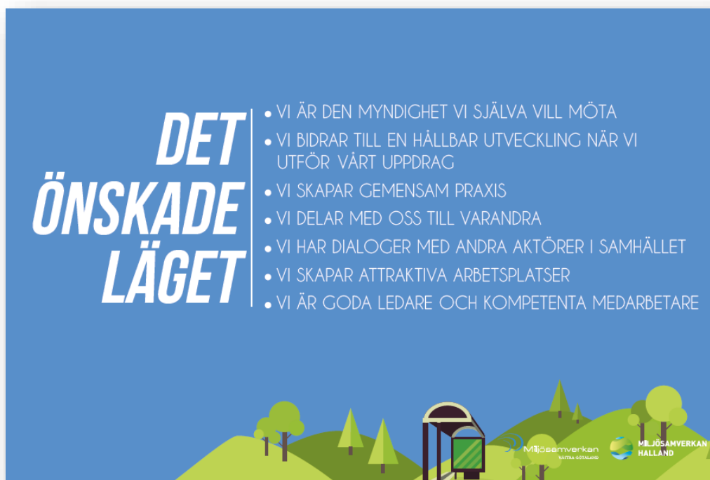
Figur 2. Det önskade läget. Miljösamverkans vision och värdegrund.